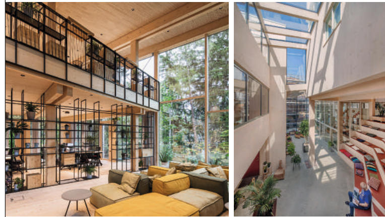
Fotos: defrancesco photography, Christian Architektur fotografie, Helen & Hard